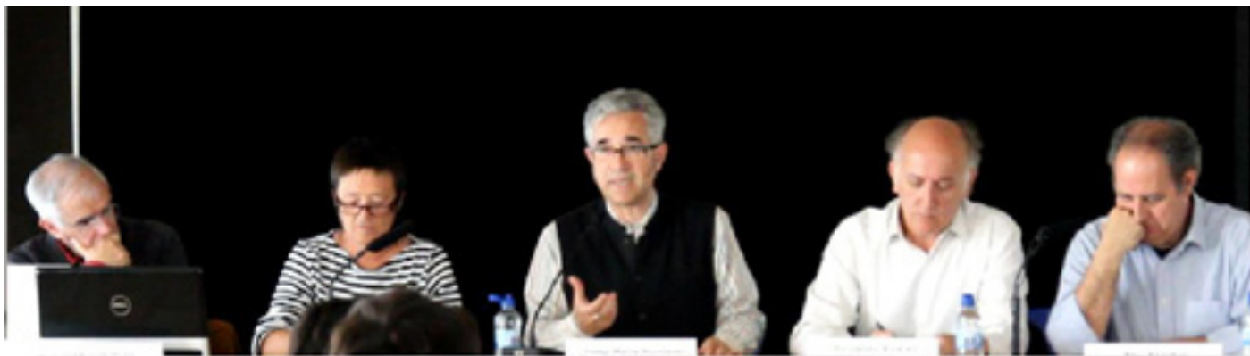
Ponents durnat la jornada celebrada a Cotxeres