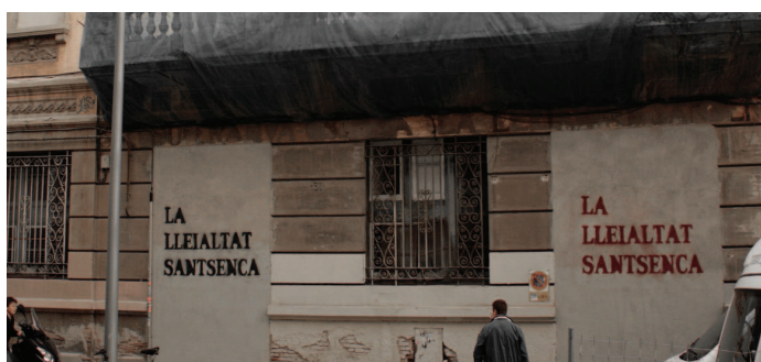
Façana de La Lleialtat Sant-senca amb el seu nom legítim

En aquest sentit, i per seguir el contacte, es va acordar una nova reunió a finals de gener de 2011.