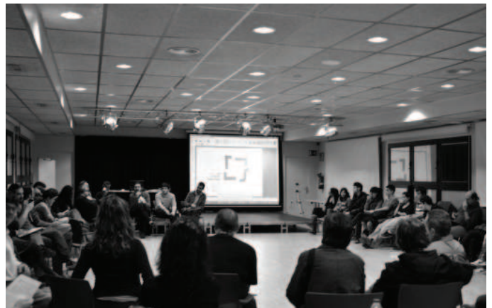
Celebració de l’Assemblea Constituent

Es dona per constituïda la Plataforma La Lleialtat Santseca, s’anima a tothom a afegir-se a les comissions i equips de treball, i s’ofereix material de difusió (cartells, díptics, xapes, etc...) a qui en necessiti.